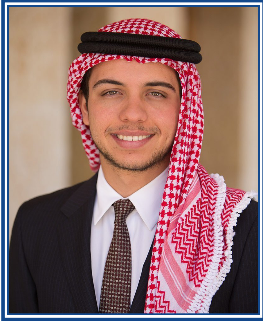
حضرة صاحب السمو الملكي الامير الحسين بن عبدالله الثاني ولي العهد المعظم